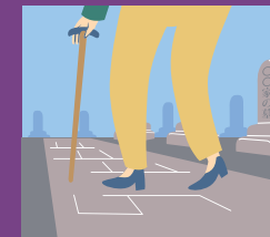
足が悪くて一人で お墓参りするのが不安