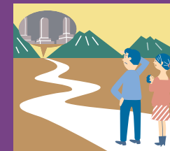
お墓のある 郷里が遠い