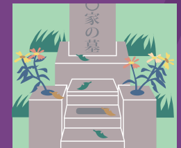
自分ではキレイに 掃除ができない